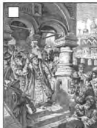
К. Е. Маковский. Иван III топчет ханскую басму (грамоту)