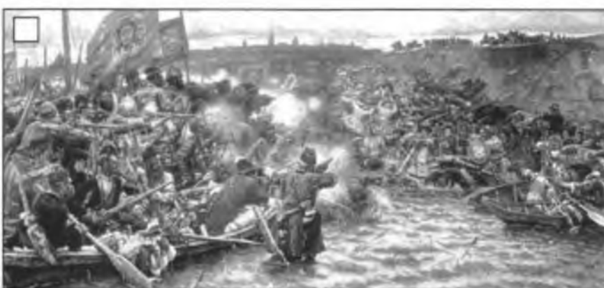
В. И. Суриков. Покорение Сибири Ермаком