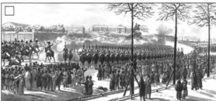
К. Кольман. Восстание декабристов