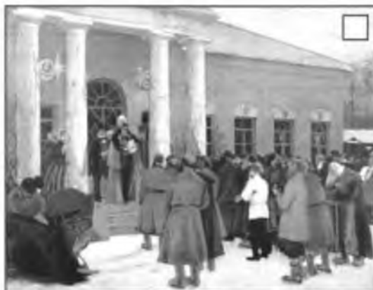
Б. М. Кустодиев. Чтение манифеста (Освобождение крестьян)

Рассмотри репродукции картин на с. 100—101. В какой последовательности произошли события, изображённые на картинах? Впиши в клеточки цифры в правильном порядке.